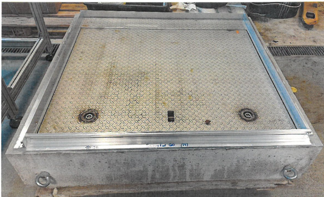
Obrázek 1: Zkouška vodotěsnosti - ACO Access Cover Servokat 800x1000 B125 emergency exit 1.4301